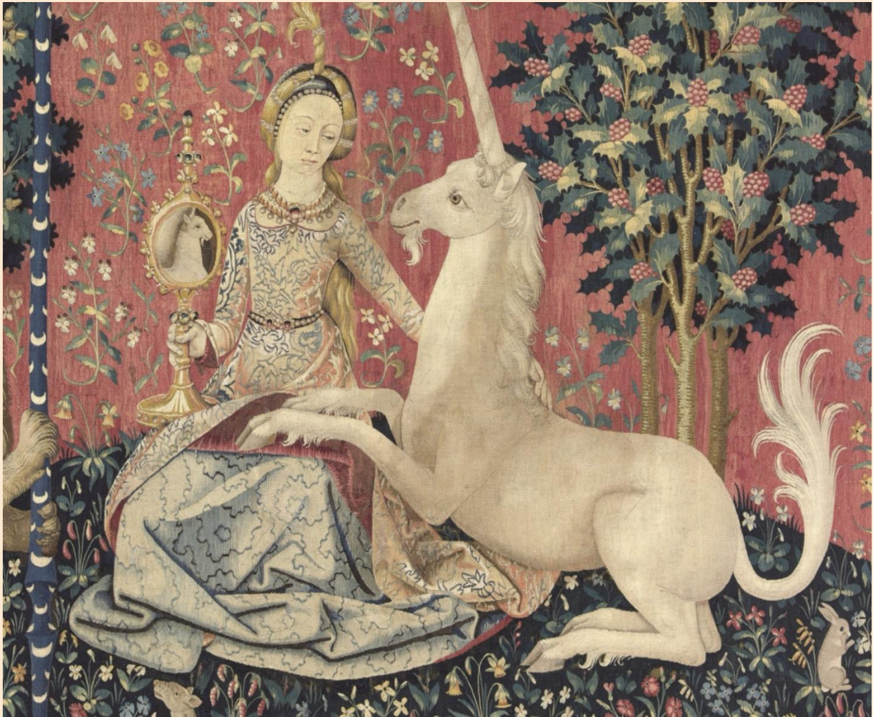
Detalle de La vue (La Dame à la licorne) - Musée de Cluny Paris (Didier Descouens, 2021)