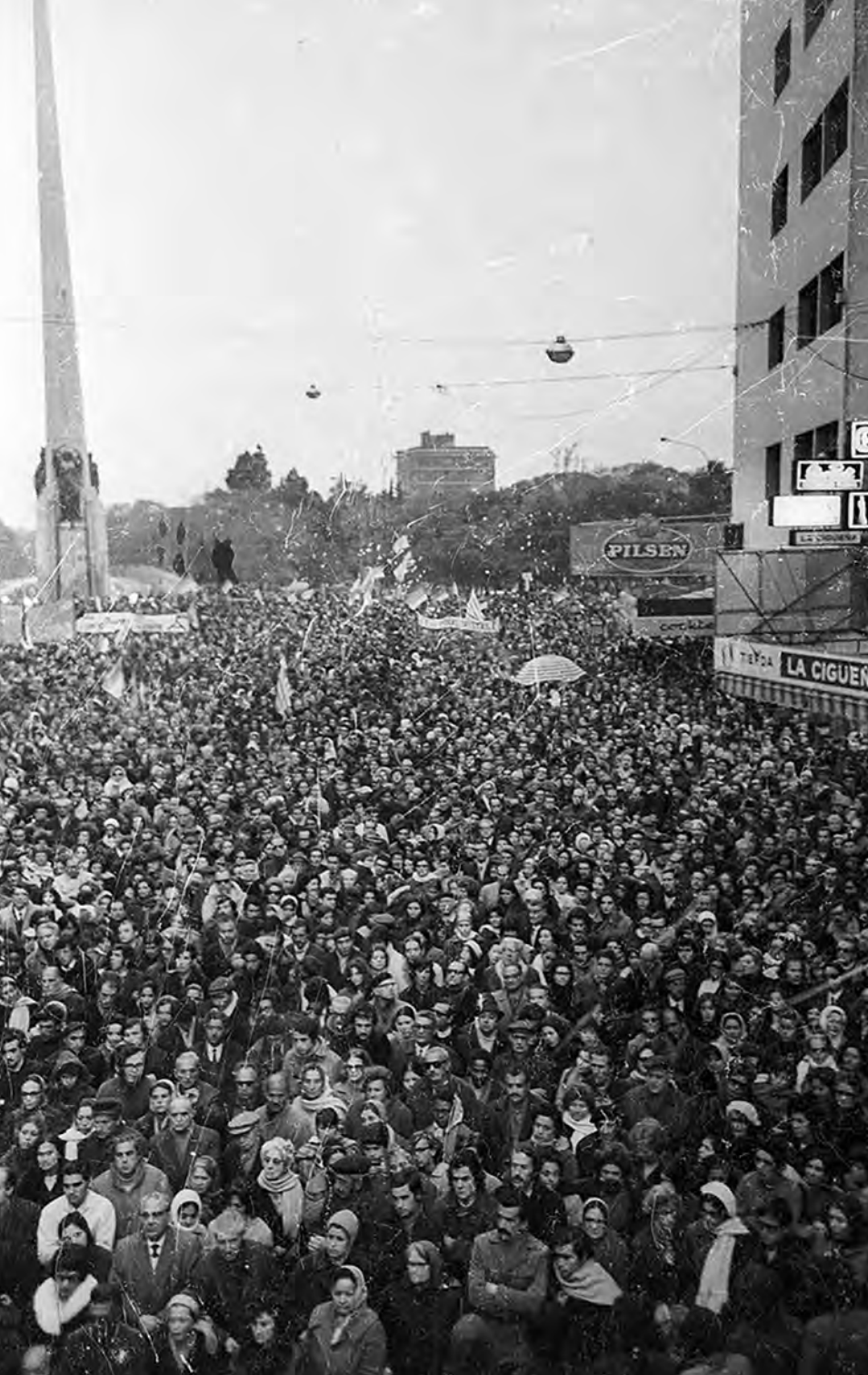
Acto del Frente Amplio, avenida 18 de Julio y Bulevar Artigas, 25 de agosto de 1972, diario El Popular .

La principal novedad en las elecciones de 1971 fue la unificación de una parte muy sustantiva de los grupos y partidos de izquierda en el Frente Amplio (que concurrió a las elecciones bajo el lema Partido Demócrata Cristiano). Su desempeño electoral en Montevideo fue destacado, convirtiéndose en la segunda fuerza política de la capital.