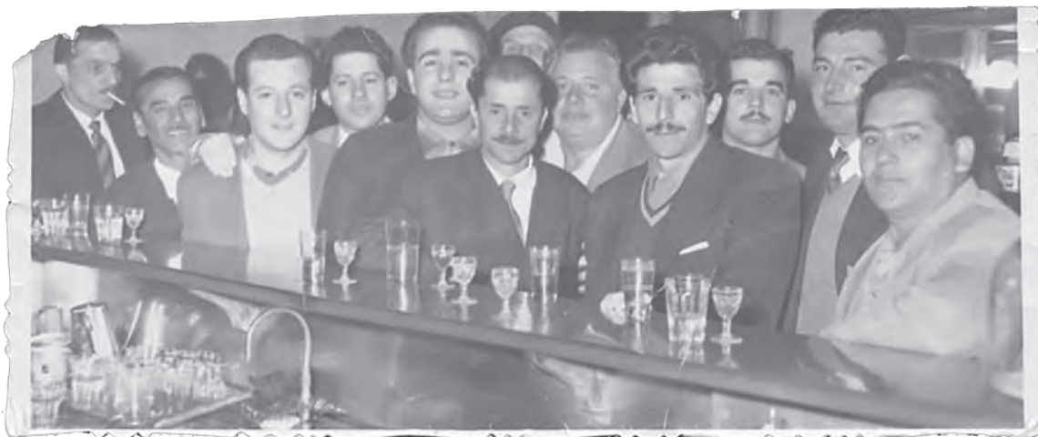
Integrantes de la Comisión de Fomento de Aires Puros, alrededor de 1950, sin datos de autoría. Fondo Particular Aires Puros, n.º 20, CdF, IM.

Las asociaciones barriales de vecinos y vecinas fueron un ejemplo de gestión participativa. Tuvieron como antecedente a las comisiones auxiliares del municipio, que funcionaron hasta mediados de la década de 1920. Hacia finales de la década siguiente surgieron varios clubes y comisiones de fomento en la ciudad, que expresaron formas diferentes de participación, alejadas, de alguna manera, de lo partidario (Nicolás Duffau, De urgencias y necesidades. Los sectores populares montevidianos a través de la documentación de una asociación vecinal: el caso de la Comisión Fomento Aires Puros (1938-1955) . Montevideo: ediciones Abrelabios, 2009, pp. 78-90).