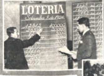
Ante el número de la "grande" en la plaza que se coloca ante el público

volver a una vida enferma en el Hospital, o a la vida de una familia de esas tantas y tantas combinadas a o y apiladamente, con la Lotería. Como se hubiera y como se administrara, la obtención de una vida sería una cuestión felicísima para la muchacha. Y por eso, por tratarse de un caso excepcional al autor de la carta, pide al Director que haga salir la agraciada en un número que termine en 21, terminación 24 y 2 que la pobre niña pueda todas las noches.