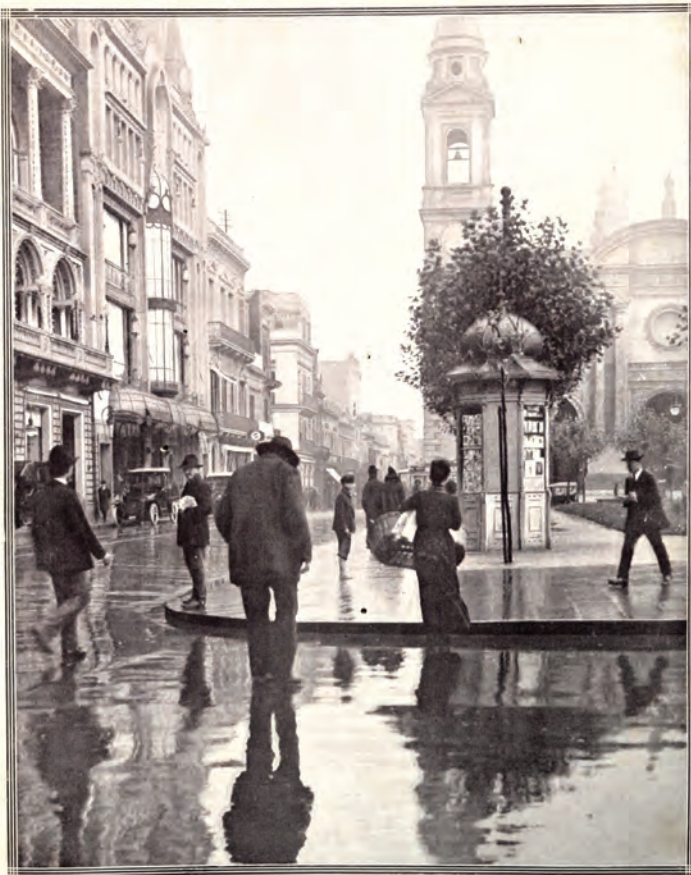
Día de lluvia en Montevideo

El tiraje del número anterior fue de 22.332 ejemplares.