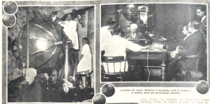
Escuchando las bolillas en el globo

volver a una vida enferma en el Hospital, o a la vida de una familia de esas tantas y tantas combinadas a o y apiladamente, con la Lotería. Como se hubiera y como se administrara, la obtención de una vida sería una cuestión felicísima para la muchacha. Y por eso, por tratarse de un caso excepcional al autor de la carta, pide al Director que haga salir la agraciada en un número que termine en 21, terminación 24 y 2 que la pobre niña pueda todas las noches.